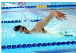
泳法 初級/初中級/中上級