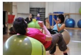
代謝アップエクササイズ